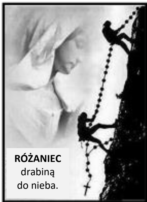
RÓZANIEC drabiną do nieba.

kontemplacyjnej”, jaką jest różaniec. Jan Paweł II podkreśla, że: „Najważniejszym motywem, by zachęcić z mocą do odmawiania różańca, jest fakt, że należy on do najlepszej i najbardziej wypróbowanej tradycji kontemplacji chrześcijańskiej. Maryja stale przypomina wiernym tajemnice swego Syna, pragnąc, by je kontemplowano i by dzięki temu mogły wydać z siebie całą swą zbawczą moc” „Różaniec bowiem z natury swej wymaga odmawiania w rytmie spokojnej modlitwy i powolnej refleksji, by przez to modlący się łatwiej oddał kontemplacji tajemnic życia Chrystusa, rozważanych jakby sercem Tej, która ze