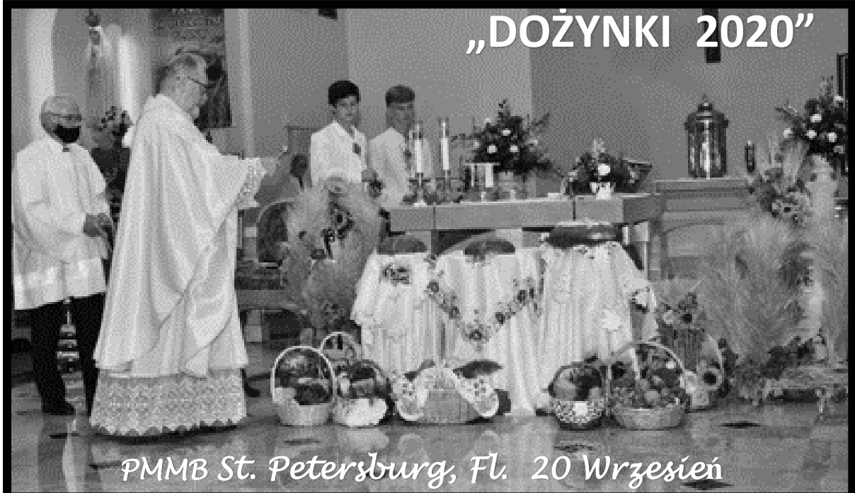
PMMB St. Petersburg, Fl. 20 Wrzesień