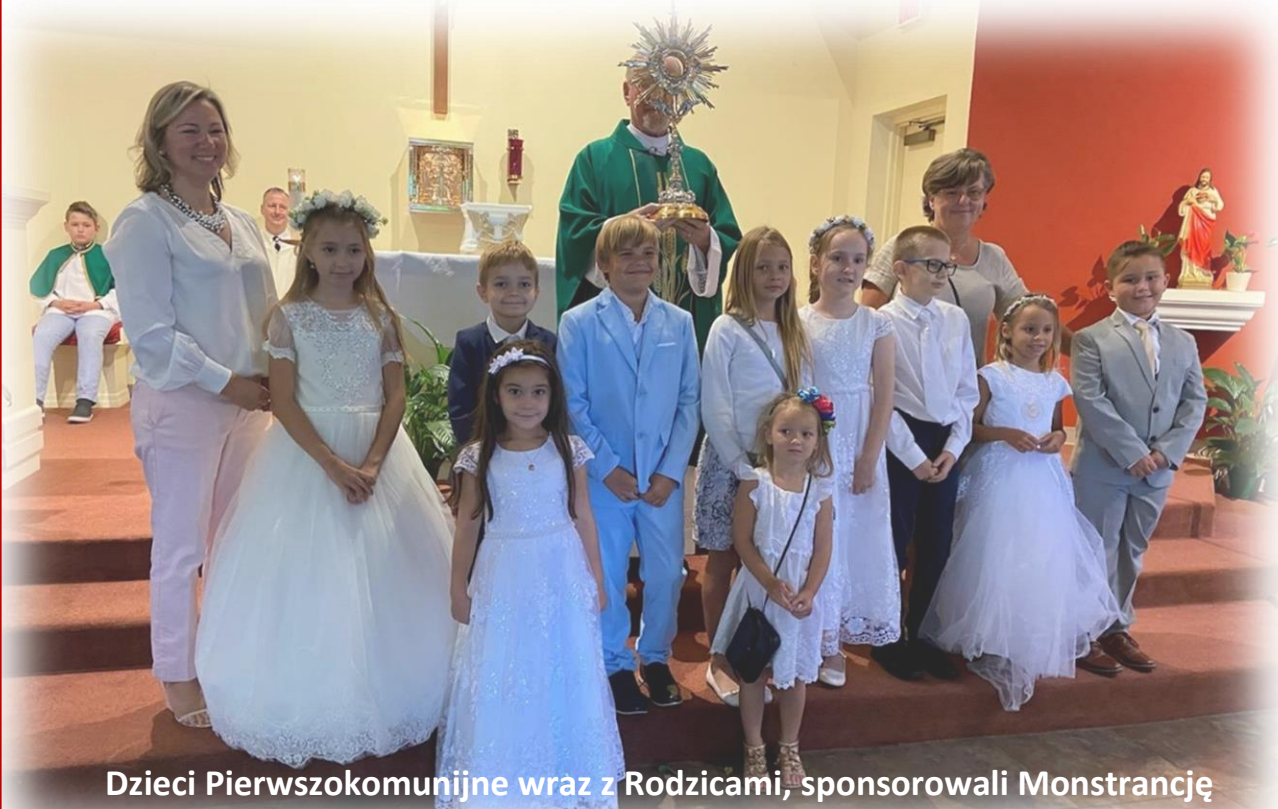
Dzieci Pierwszokomunijne wraz z Rodzicami, sponsorowali Monstrancję dla kościoła w Port Richey.